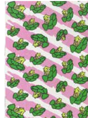
ANNIKEN ύφασμα με το μέτρο 6€/μ. 203.081.07