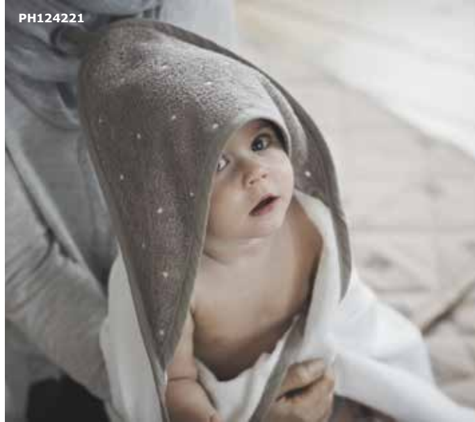
ÄFJÄRDEN πετσέτα μπάνιου 12,99€ 201.906.26