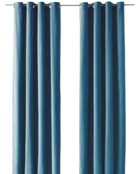
SANELA κουρτίνα 74,99€ 702.619.42