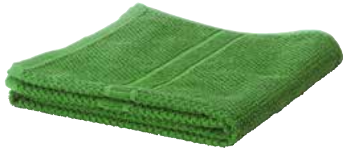
PH034000 SLAPPA πετσέτα με κουκούλα 14,99€ 802.520.13