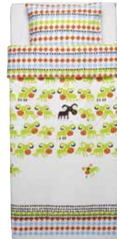
FANTASIDJUR παπλωματοθήκη και μαξιλαροθήκη για κούνια 9,99€ 902.342.50