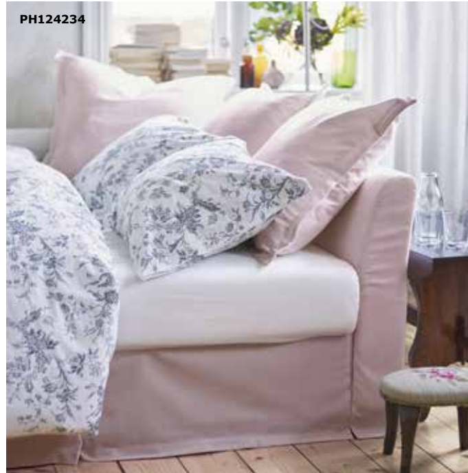
GULLTRATT παπλωματοθήκη και μαξιλαροθήκη 19,99€ 902.989.11