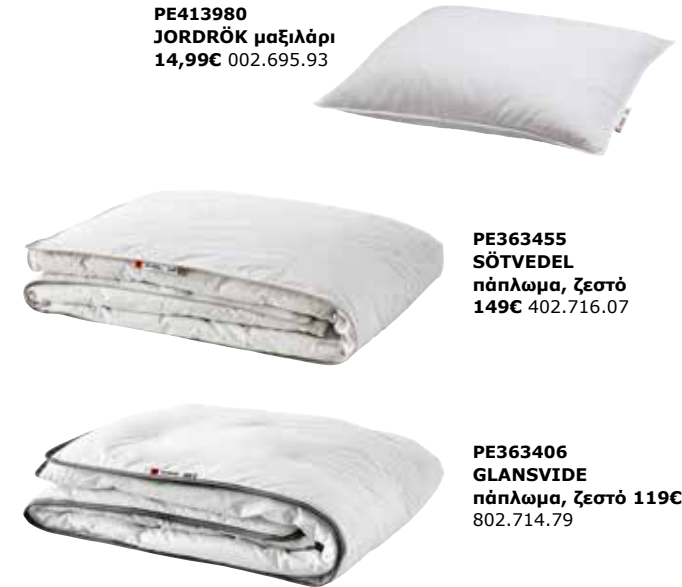
PE413980 JORDRÖK μαξιλάρι 14,99€ 002.695.93