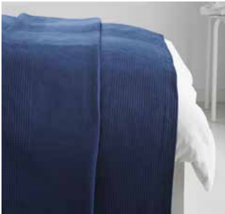
INDIRA κάλυμμα κρεβατιού 16,99€ 201.917.63