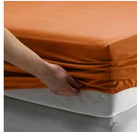
DVALA σεντόνι με λάστιχο 6,99€ 90X200cm 402.896.26