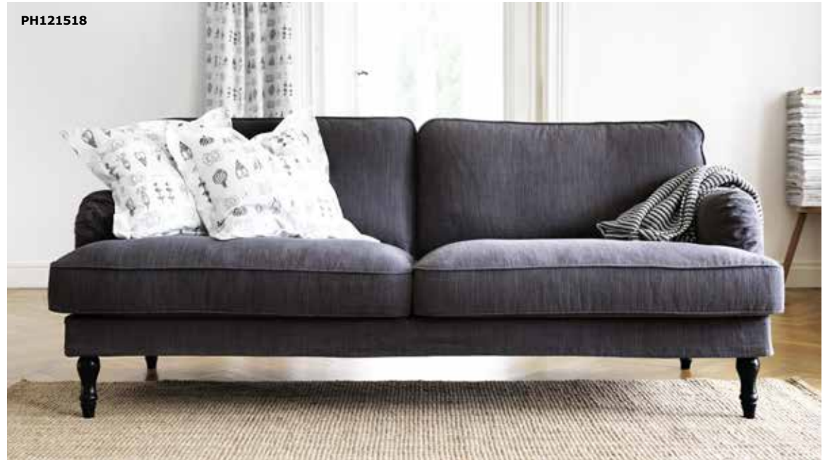
SYSSAN κουρτίνα 69,99€/2 τεμ. 502.951.51