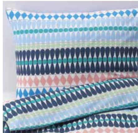
MOSSFLOX παπλωματοθήκη και 2 μαξιλαροθήκες 29,99€ 703.089.73