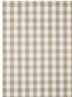
BERTA RUTA ύφασμα με το μέτρο 8,50€/μ. 302.171.21