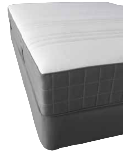
HÖVÅG στρώμα με ελατήρια σε θήκες 339€ 102.445.16