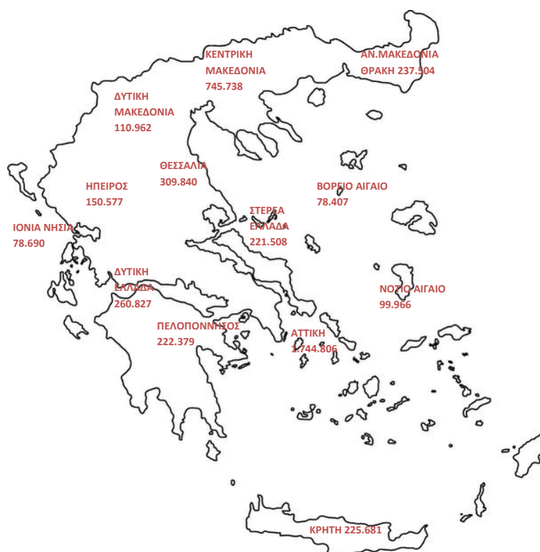
Χάρτης 1: Καταβολή Συντάξεων ανά Περιφέρεια

Στον Πίνακα 25 αποτυπώνονται τα ποσά σύνταξης που αντιστοιχούν σε κάθε Περιφέρεια σε σχέση με το αντίστοιχο ΑΕΠ για το έτος 2013 (προσωρινά στοιχεία ΕΛΣΤΑΤ). Σύμφωνα με τα δεδομένα του Πίνακα, στην Περιφέρεια Ηπείρου παρατηρείται η μεγαλύτερη τιμή (21,7%) του λόγου ποσού σύνταξης προς ΑΕΠ και ακολουθεί η Περιφέρεια Θεσσαλίας με τιμή 19,8%. Στην τελευταία θέση βρίσκεται η Περιφέρεια Νοτίου Αιγαίου με τιμή 10,2%.