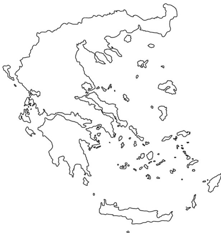
Χάρτης 1: Καταβολή Συντάξεων ανά Περιφέρεια

Στον Πίνακα 10 αποτυπώνονται τα ποσά σύνταξης που αντιστοιχούν σε κάθε Περιφέρεια σε σχέση με το αντίστοιχο ΑΕΠ για το έτος 2010 (προσωρινά στοιχεία ΕΛΣΤΑΤ). Σύμφωνα με τα δεδομένα του Πίνακα 10, στην Περιφέρεια Ηπείρου παρατηρείται η μεγαλύτερη τιμή (17,5%) του λόγου ποσού σύνταξης προς ΑΕΠ και ακολουθεί η Περιφέρεια Θεσσαλίας με τιμή 17,2%. Στην τελευταία θέση βρίσκεται η Περιφέρεια Νοτίου Αιγαίου με τιμή 7,8%.